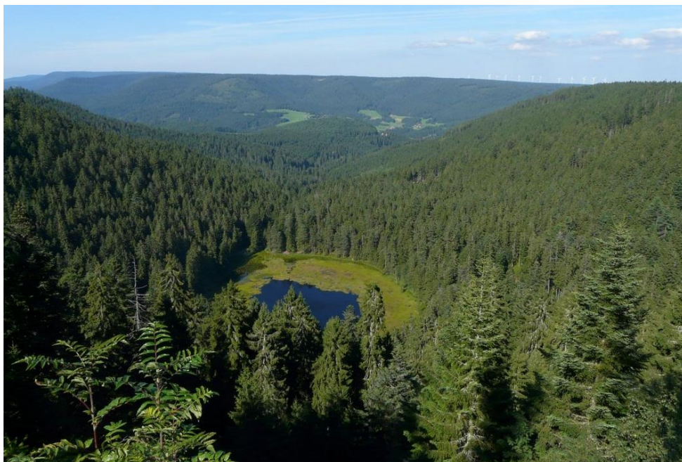
Blick auf den Huzenbacher See

Ach ja, der Huzenbacher See und der Seeblick . Wer mit einem Abstand von mehr als 100 km anreist, 2 Tage minimum hier ist, sollte unbedingt die Chance nutzen und „etwas wandern“. 2 Stunden sind normal, mit 2-3 Stunden auch für zarte Stadtmenschen geeignet. So siehts aus: